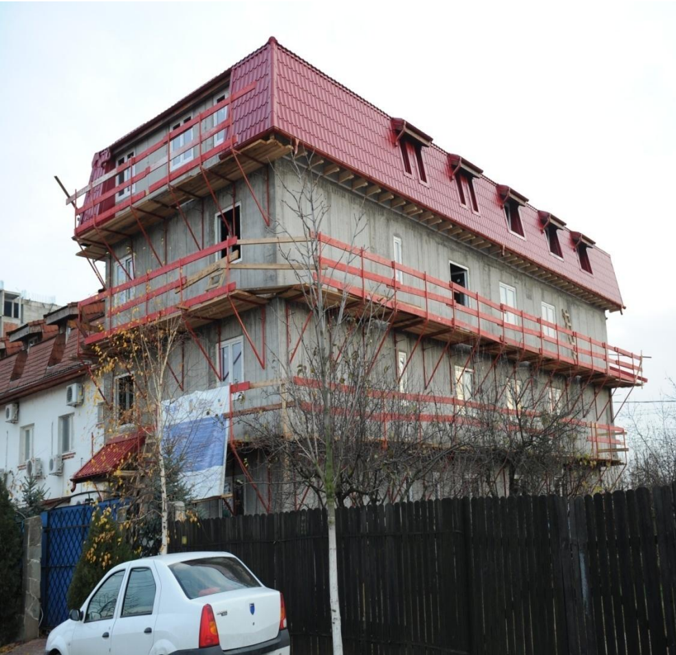
FUNDATIA SFANTA IRINA Cancerul, prioritate absoluta- dezvoltarea unui sistem real de servicii sociale