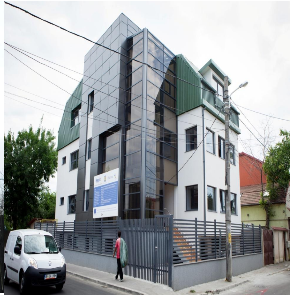
DGASPC SECTOR 2 Centrul de servicii de asistenta sociala pentru persoane varstnice