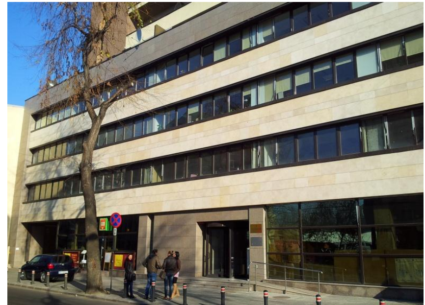
Mihai Eminescu nr. 163, Sector 2, Bucuresti