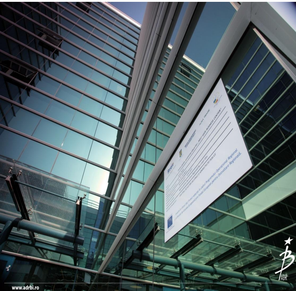
Centru pentru sprijinirea afacerilor „WEST GATE BUSINESS CENTER“