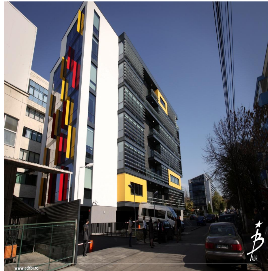
Centru de sprijinire a afacerilor Siriului